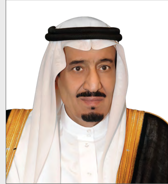
خادم الحرمين الشريفين الملك سلمان بن عبدالعزيز آل سعود