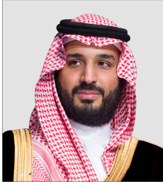
ولي العهد صاحب السمو الملكي الأمير محمد بن سلمان بن عبدالعزيز آل سعود